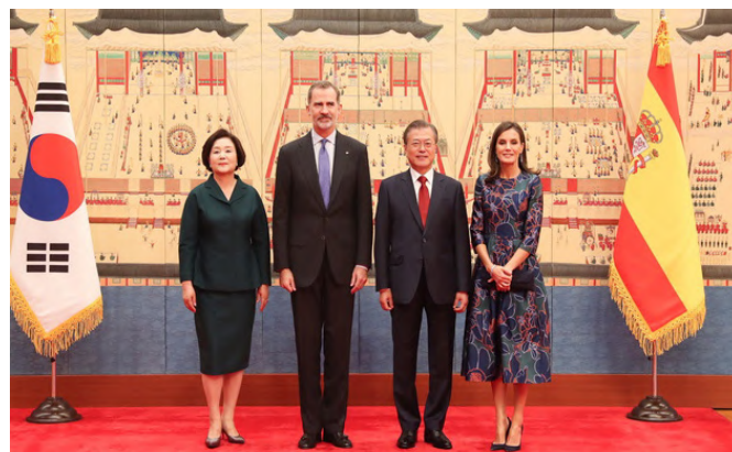
Sus Majestades los Reyes junto al anterior presidente de Corea, Moon Jae-in y la primera dama de la República de Corea, Kim Jung-sook, tras el recibimiento oficial.- Seúl (República de Corea), octubre .2019.- © Casa de S.M.

Fuente: Secretaría de Estado de Comercio (DATACOMEX).