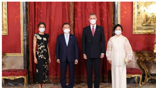
Sus Majestades los Reyes y sus Excelencias Moon Jae-in, Presidente de la República de Corea y señora Kim Jung-sook.- Palacio Real de Madrid, 16.06.2021.

Ministro del Interior y Seguridad: LEE Sang-min